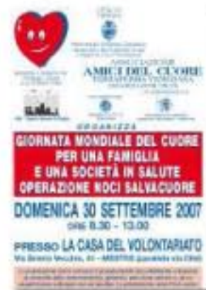
settembre 2007, giornata mondiale del cuore