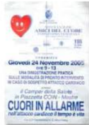
novembre 2005, dimostrazione pratica di pronto intervento