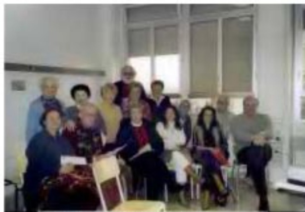
Alcuni dei volontari attivi in Associazione