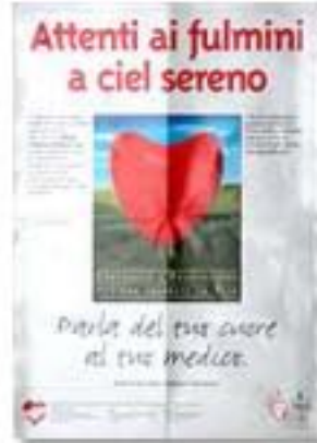
2004, sostegno alla campagna di prevenzione del Ministero della Salute