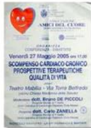
maggio 2005, conferenza: Scompenso cardiaco cronico, prospettive terapeutiche