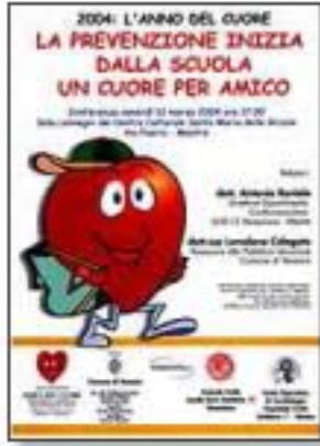
marzo 2004, conferenza: La prevenzione inizia dalla scuola

• Sono numerose le iniziative concrete che abbiamo organizzato e continuiamo ad organizzare sul territorio. Ecco alcuni esempi: