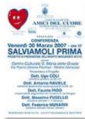
marzo 2007, conferenza "salviamoli prima"