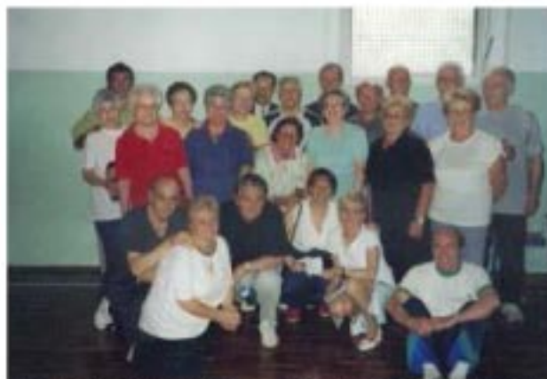
Un gruppo dopo la lezione di ginnastica in palestra