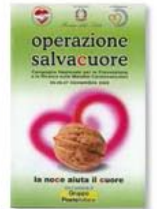
novembre 2005, campagna nazionale per la prevenzione e la ricerca sulle malattie del cuore