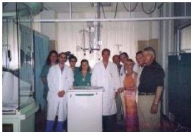
Donazione carrello porta farmaci all'unità coronarica UTC nel giugno 2003

Per informazioni: tel. 041 982487 - 041 2697913 info@amicidelcuore.net