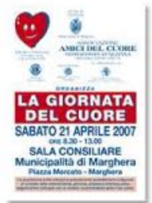
aprile 2007, La giornata del cuore