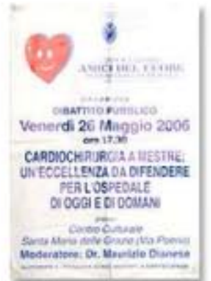
maggio 2006, dibattito pubblico sul futuro della cardio chirurgia