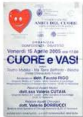
aprile 2005, conferenza: Cuore e vasi