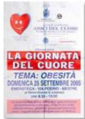
settembre 2005, giornata del cuore (tema: l'obesità)