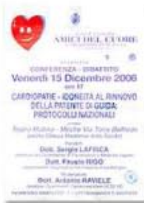
dicembre 2006, conferenza sul rinnovo della patente di guida