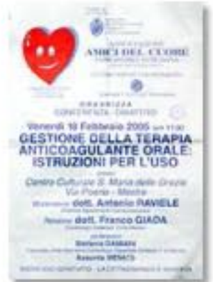
febbraio 2005, conferenza: Gestione della terapia anticoagulante orale